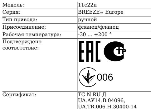
Таблица 1. Характеристики