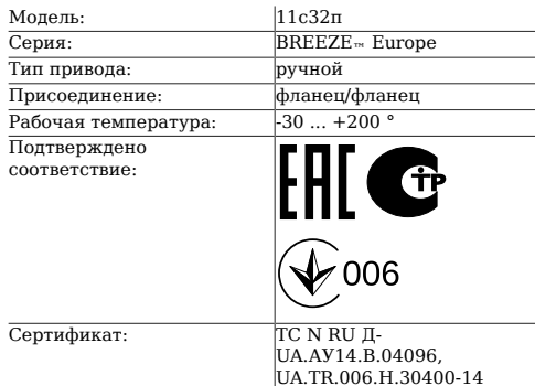
Таблица 1. Характеристики