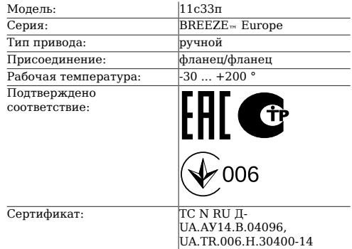
Таблица 1. Характеристики