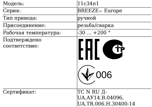
Таблица 1. Характеристики