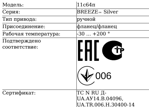
Таблица 1. Характеристики