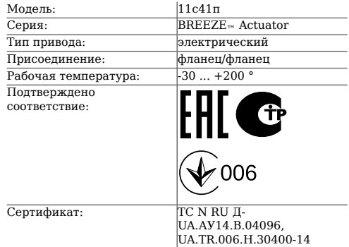
Таблица 1. Характеристики