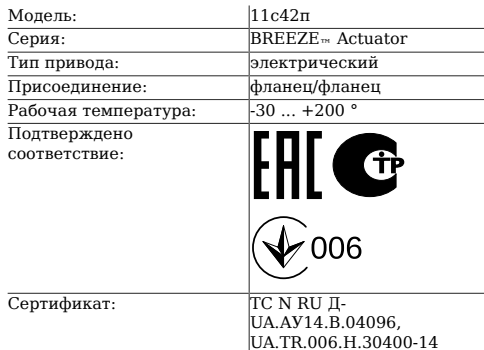
Таблица 1. Характеристики